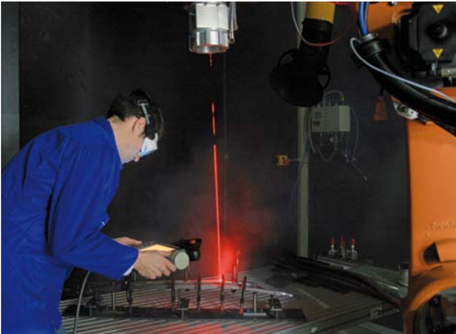
Abbildung 1: Laserstrahlung trifft im Fokus auf passive Schutzwand (Laserstrahlquelle: Faserlaser mit 8 kW, Spotdurchmesser: 800 µm, Abstand: 1000 mm, Schutzwandmaterial: Stahlbeton mit 16 cm Dicke)