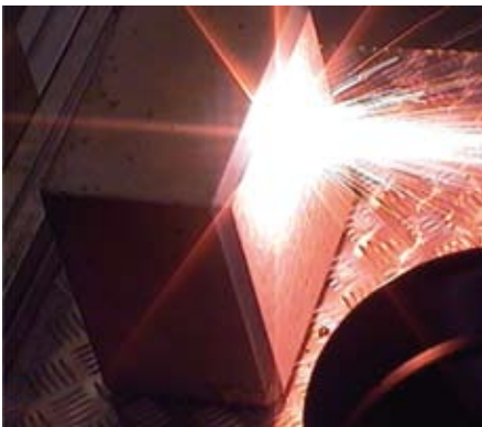
Abbildung 2: Gefahr bei Prozesseinrichtung (Brennweite: 1200 mm, Strahl rot eingefärbt)

Strahlung und bis zu 30 kW für Multimode Strahlung auf. Dabei wird die Laserstrahlung mit Hilfe von flexiblen Lichtwellenleitern von der Laserstrahlquelle zur Laseroptik geleitet. In vielen Fällen wird die Laseroptik mit Hilfe von Robotern bewegt. Hierbei wird eine räumlich freie Orientierung dieser Optik ermöglicht. Im Vergleich zu konventionellen Systemen sind die erreichbaren Arbeitsabstände sehr groß. Durch sie können mit kleinen Winkeländerungen der Optik große Strecken überstrichen und somit hohe Fertigungsgeschwindigkeiten erzielt werden.